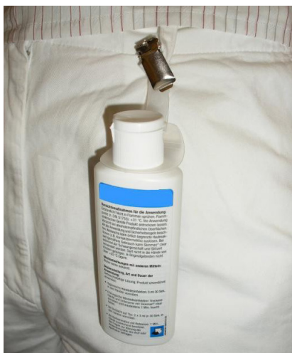
Abb. 4: Viele Hersteller bieten für Kitteltaschenflaschen praktische Clipbefestigungen an.

Es muss gesichert sein, dass die Mittel und Vorrichtungen zur Händehygiene überall dort zu finden sind, wo sich erfahrungsgemäß die Notwendigkeit zur Durchführung ergibt. Wenn dies nicht gegeben ist, besteht die Gefahr, dass wichtige Maßnahmen der Händehygiene unterbleiben. Daher sollen unterschiedliche Möglichkeiten zur Verfügung stehen: