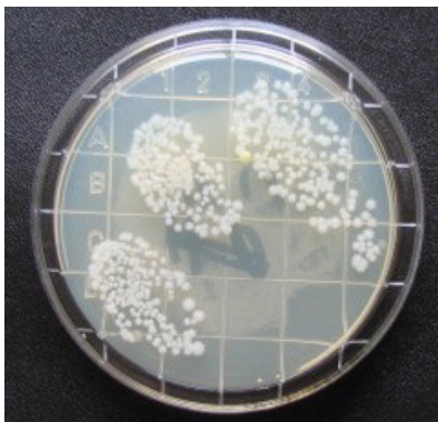
Abb. 1: Keimwachstum nach Berührung eines Nährmediums mit der bloßen Hand

Die wirkungsvollste Maßnahme zur Unterbindung von Kontaktübertragungen zum Schutz der Bewohner und des Personals im Pflegebereich besteht daher in einer verlässlichen und sachgemäßen Durchführung der Händehygiene.