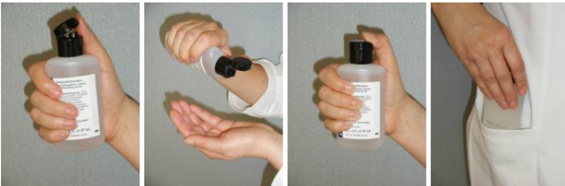
Abb. 11: Korrekte Handhabung von Kitteltaschenflaschen

Wie gehe ich vor, wenn die Hände mit (potenziell) infektiösen Materialien sichtbar verschmutzt sind?