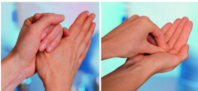
Abb. 9: Bei der Durchführung ist vor allem auf den Einbezug der Fingerkuppen und des Daumens zu achten. 2*

Zunächst ist darauf zu achten, dass die Händedesinfektion möglichst sofort erfolgt, wenn sich die Notwendigkeit dazu ergibt und nicht dann, wenn man mal wieder an einem Spender vorbei kommt.