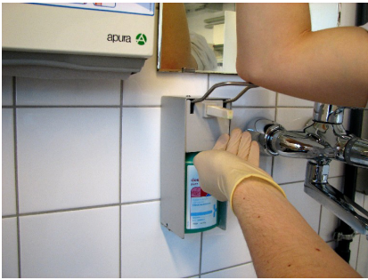
Abb. 15: Umstritten: Die Desinfektion von Schutzhandschuhen