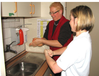
Abb. 8: Bei Kolonisationen, Infektionen und Infektionsausbrüchen sind Bewohner und Besucher in die Händedesinfektion einzuweisen.

Welche Personengruppen sind zur indikationsgerechten Händedesinfektion angehalten?