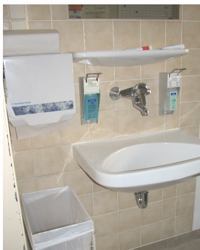
Abb. 5: Komplett ausgestattetes Handwaschbecken

Wie soll ein Handwaschbecken beschaffen und ausgestattet sein?