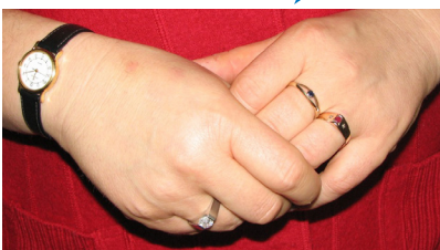
Abb. 2: Auf Handschmuck sollte bei allen medizinisch-pflegerischen Tätigkeiten verzichtet werden

Warum ist der Verzicht auf Handschmuck so wichtig?