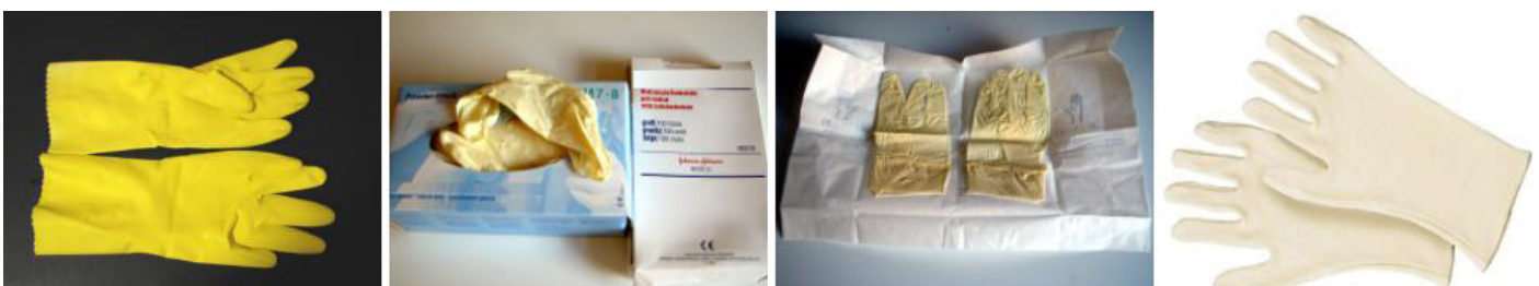
Abb. 13: Handschuharten: Von links nach rechts: Haushaltshandschuhe, Medizinische Einmalhandschuhe bzw. Schutzhandschuhe, sterile Handschuhe, Unterziehhandschuhe