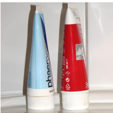
Abb. 3: Für einen effektiven Hautschutz sollen sowohl Handpflege, als auch Hautschutzcremes zur Verfügung stehen.

Worin unterscheiden sich Handpflege- von Hautschutzcremes?