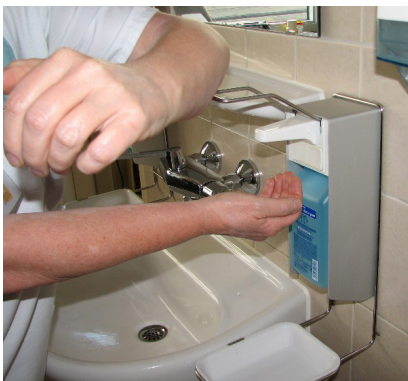
Abb. 10: Korrekte Bedienung eines Händedesinfektionsmittelspenders

Spender bieten im Vergleich zu Kittelflaschen den großen Vorteil, dass sie „berührungsfrei“ benutzt werden können, indem der Dosierhebel nicht mit der Hand, sondern mit dem Ellbogen bedient wird.