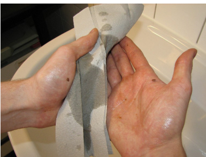
Abb. 12: Desinfektion verschmutzter Hände